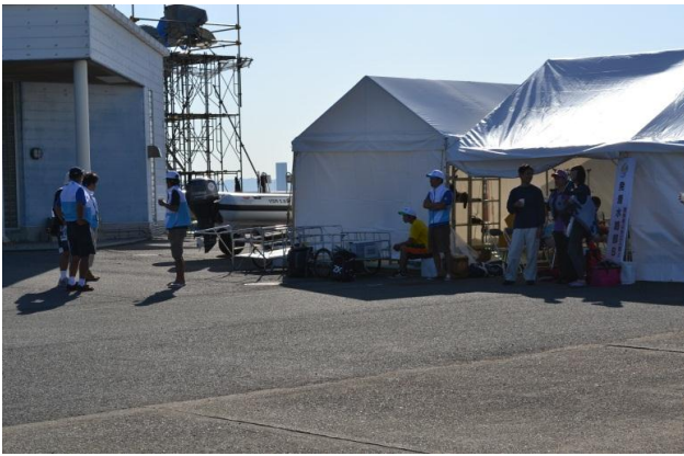
発着水路部テント。