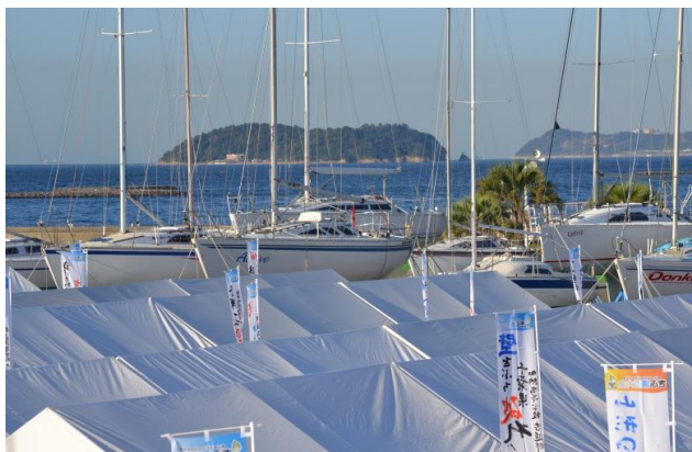
朝から西風が吹いています。