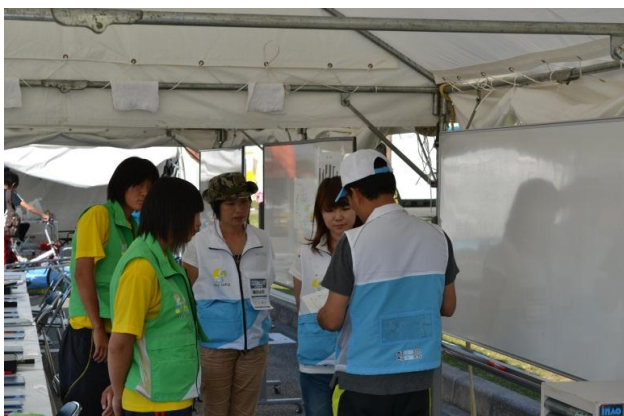
レース申告所ミーティング風景。