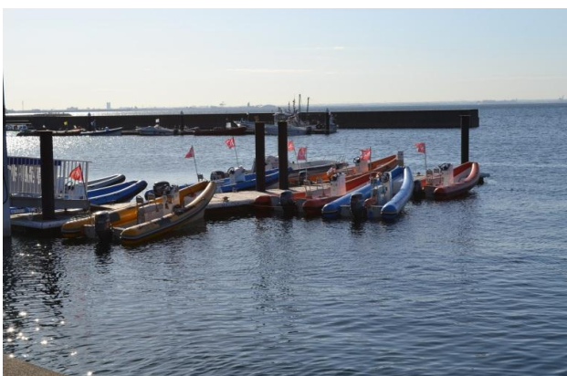
ジュリーボート、VSR8艇で編成されています。