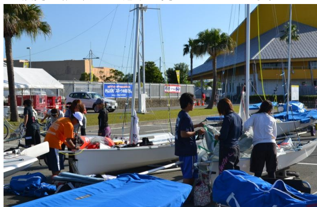
愛知県チームの朝の艀装風景。