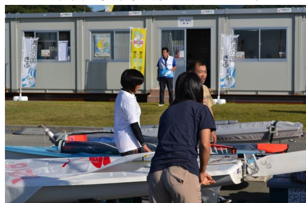
愛知県チームの朝の艀装風景その2。