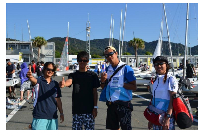
次年度開催の東京都メンバー。