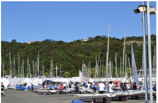
選手団も続々と集まってきました。