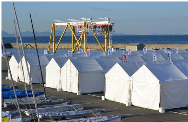
未だ選手団は来ていません。AM06:40