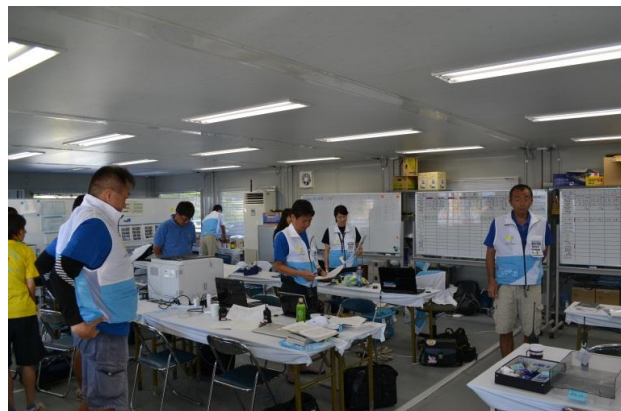
レース委員会事務局の朝のミーティング。