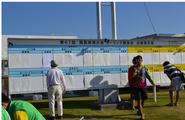
成績掲示板、初日の結果が掲示されています。