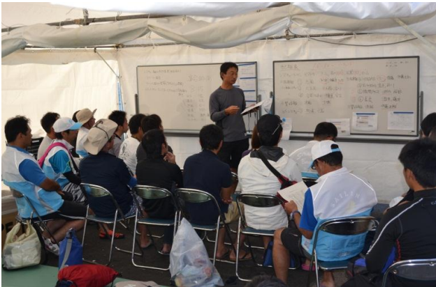
海上安全部ミーティング風景。