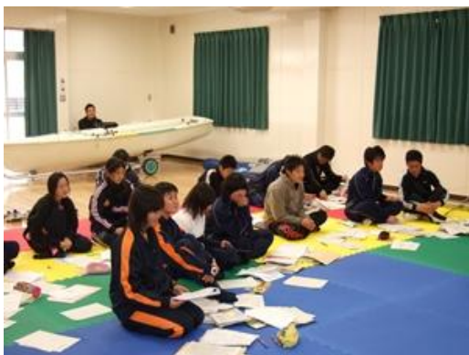
受講生 海津明誠高校ヨット部員